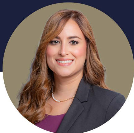
HON. JAMIE BARLUCEA RODRÍGUEZ